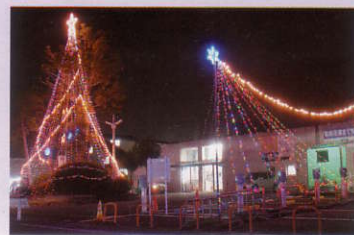
JR荒木駅前のイルミネーション