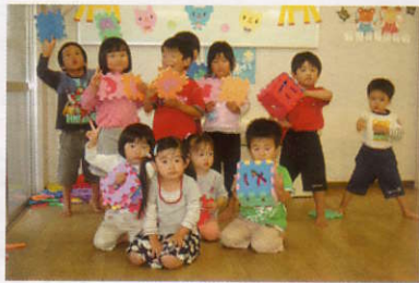
託児所の子どもたち

育児や職場復帰に関する相談窓口を設け、仕事と家庭の両立の調整なども行っていききたい、と今後の取り組みについても語っていただきました。