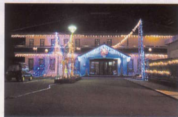
善導寺コミュニティセンター