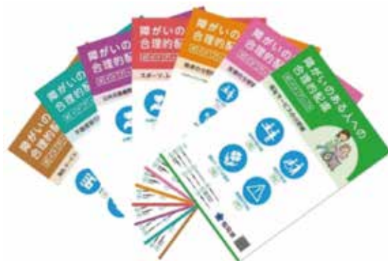
福岡県「障がいのある人への合理的配慮ガイドブック」