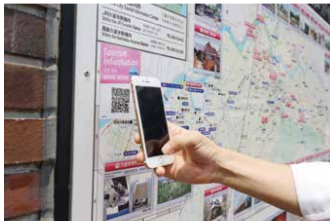
観光案内板にもQRコードを掲載