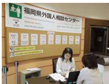
在留外国人についてのさまざまな相談に応じます

また、毎月第3土曜日に、久留米市本庁舎で行政書士や社会保険労務士などの専門家による出張相談会を実施しています。