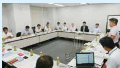
中小企業の海外展開に関する意見交換会 (昨年の様子)