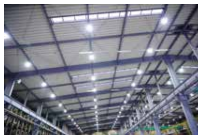
LED照明に変更し 明るくなった工場

国は、事業所の工場や事業場、住宅、ビルなどの省エネ化を、補助金の交付などにより支援しています。