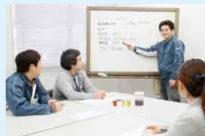
久留米リサーチ・パークで製品の分析を支援