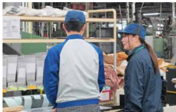
ぼるての職員(右)が職場訪問をして作業手順の確認などを行います

2～3カ月に1回、障害者就業・生活支援センター「ぼるて」に、職場訪問していただいています。障害を持つ社員の業務中の様子などを確認してもらっています。以前は、適切な指示や配慮ができるか不安に感じていました。障害を持つ社員と会社の人事担当者それぞれの悩みを聞いてもらい、障害を持つ人への接し方や指導方法、業務の進め方に対するアドバイスをもらえるので助かっています。