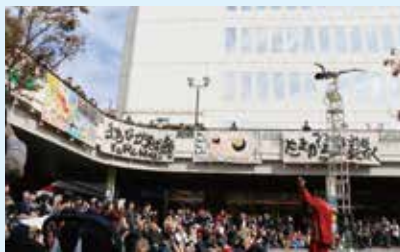
中心市街地で行った大道芸イベント (昨年の様子)