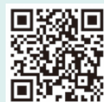
福岡県外国人相談センター facebookのQRコード

問 福岡県国際交流センター こくさいひろば ☎0120-279-906(通話無料) 📧 fukuoka-maic@kokusaihiroba.or.jp