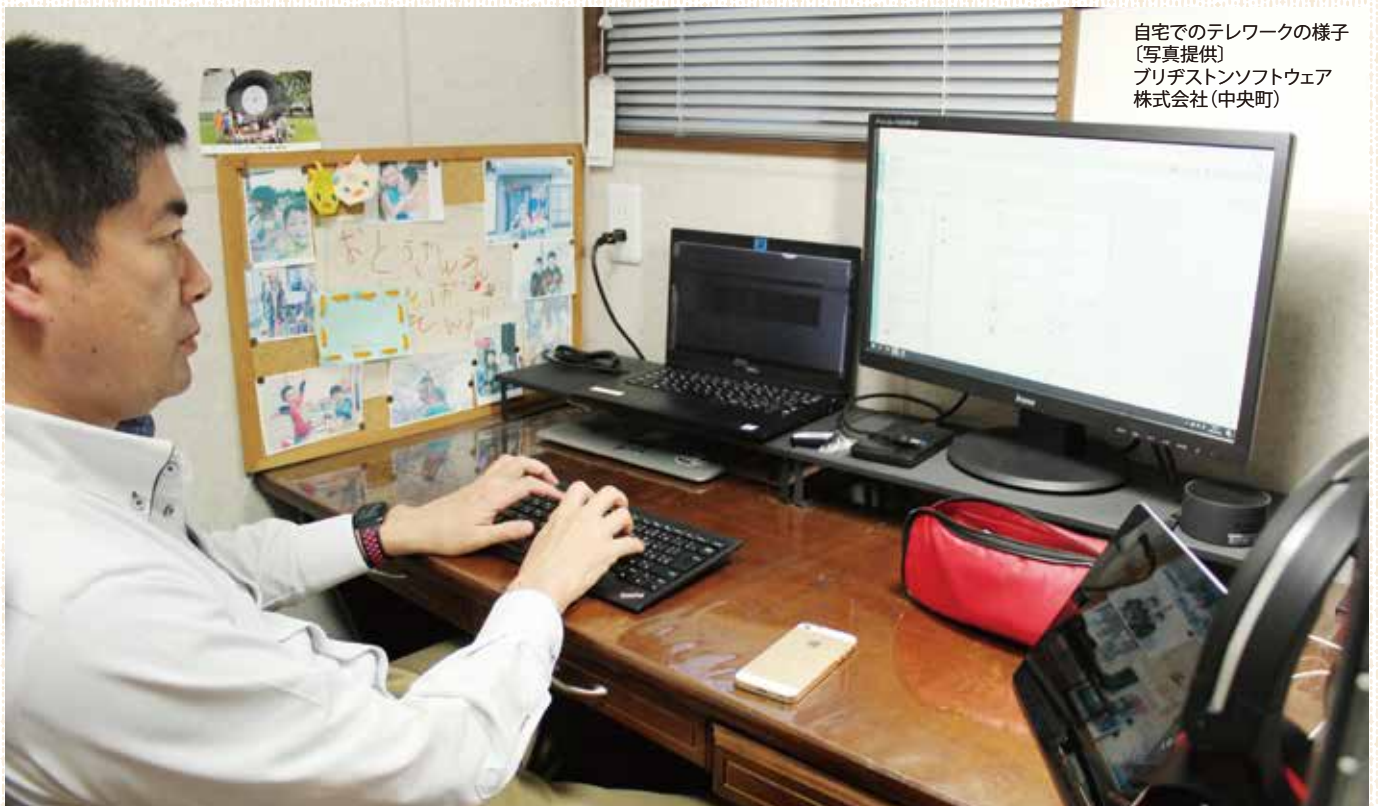
自宅でのテレワークの様子