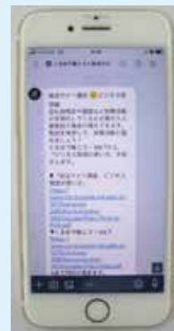
LINEで企業情報や 就職活動に役立つ 情報を配信