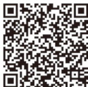
くるめ観光案内マップのQRコード

※サイトに接続すると端末の位置情報が取得されることがありますが、個人を特定するものではありません