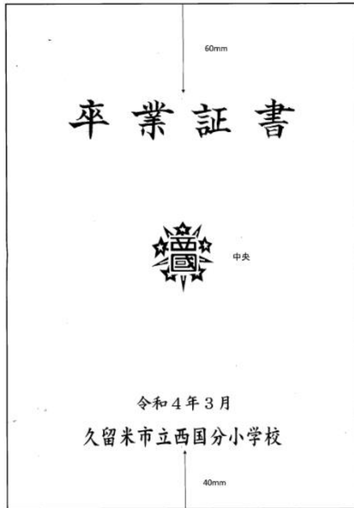
①見本 <西国分小学校>