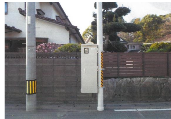
国分宮所道マンホールポンプ場（施工後）