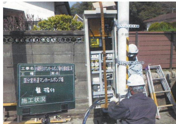
国分宮所道マンホールポンプ場（施工中）