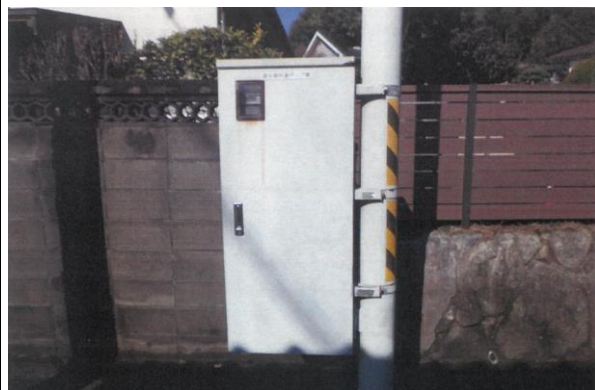
国分宮所道マンホールポンプ場（施工前）