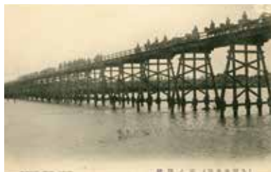
左/水天宮梅林寺篠山城址図絵 中上/水天宮御社殿全景 中下/篠山神社・将軍梅 右上/筑後史料(第一集)将軍梅(三井郡) 右下/(久留米名勝)宮ノ陣橋