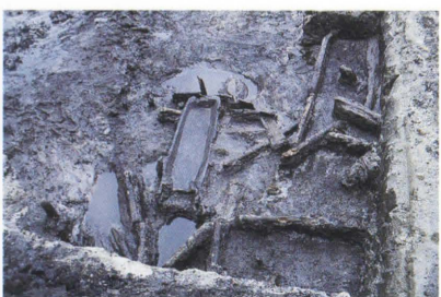
瀬ノ上遺跡出土土器

また、巨瀬川以南の水田は、奈良時代に条里制と呼ばれる田圃の区画整備が行われています。