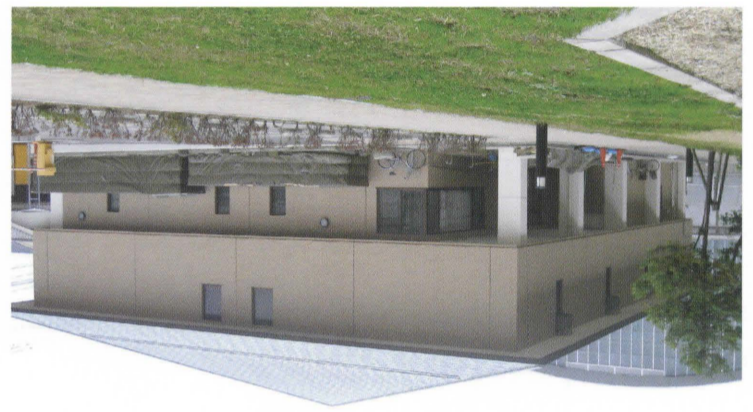
久留米市理蔵文化財センターのご案内

市内の遺跡から出土した土器や、図面・写真などの記録を収蔵・整理・研究するため、平成6年4月に『考古の歴史とふれあふ展』や毎年秋には『考古の歴史とふれあふ展』を開催し、合わせて体験学習や現地説明会など盛りだくさんの企画を行っています。 歴史に興味のある方もない方も気軽にどうぞ下さい。 開館時間：午前9時～午後5時 休館日：土・日・祝祭日・年末年始 入館料：無料