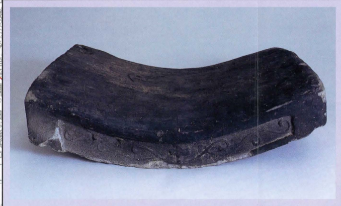
久留米城下町遺跡 (両替町遺跡) 出土のキリシタン瓦 今の市役所が建っている場所には、桃山時代に、キリスト教会が建っていました。市役所内には、教会の復元模型があります。