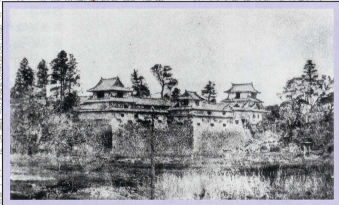
明治時代初めの久留米城 (南西から撮影) 明治時代に取り壊される前の久留米城の姿です。