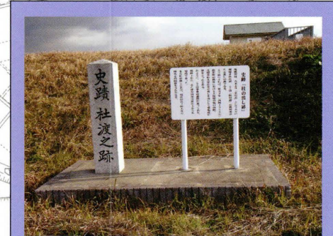
⑨杜の渡し碑 円通寺の南側、筑後川の堤防 上にあります。