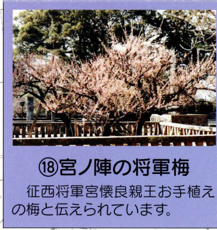
⑱宮ノ陣の将軍梅 征西将軍宮懐良親王お手植え の梅と伝えられています。