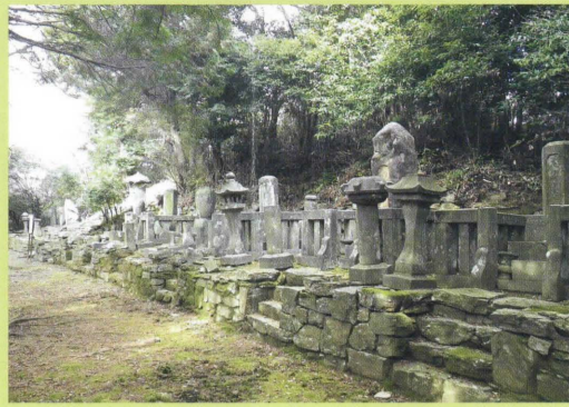
かいざんどうあと 58 開山堂跡 きんせいざすぼち (近世座主墓地)