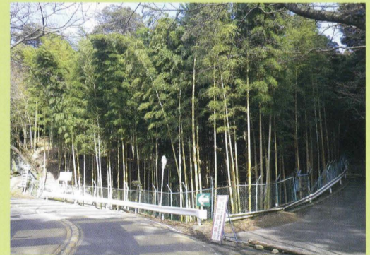
こうらさん 75 高良山のモウソウキンメイチク林 くにしてい (県指定)