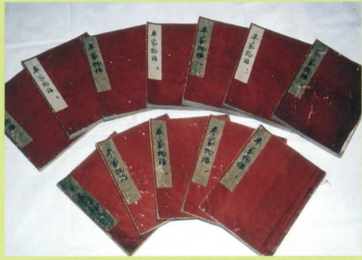
69 しほんぼくしょへいけものがたり 紙本墨書平家物語 くにしてい (国指定)