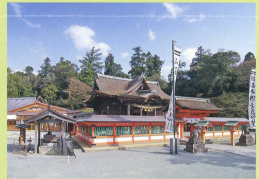
こうらたいしゃほんでんへいでん 66 高良大社本殿・幣殿 および あよはいでんくにしてい 及び拝殿(国指定)