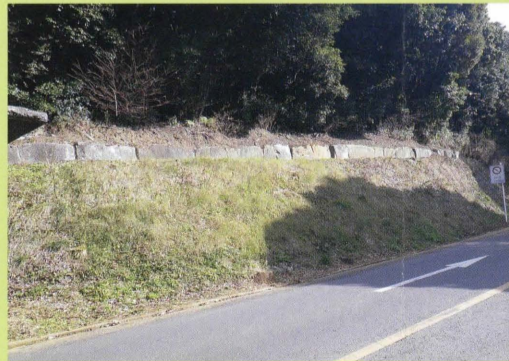
こうらさんこうこいし 74 高良山神籠石 くにしてい (国指定)