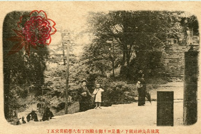
丁五宮糶稲大石丁四殿本御リ=足景ノ下院社神良高後筑