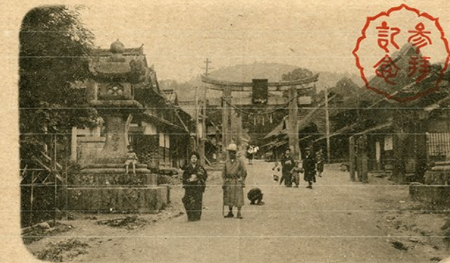
居島ノ一社神良高社大幣園後筑