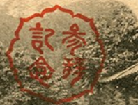
こうらさんこういし ⑤高良山神籠石