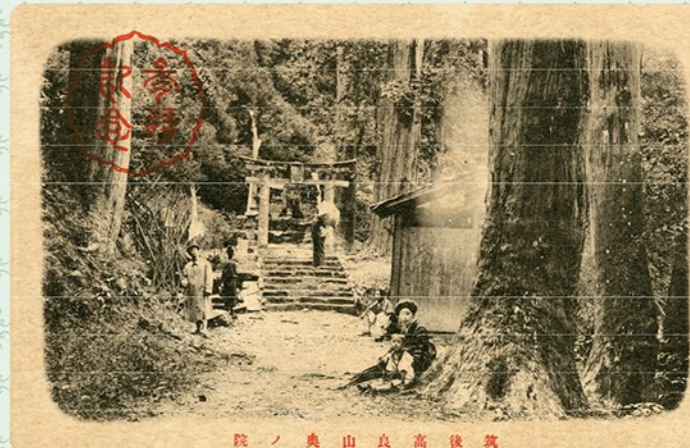
院ノ奥山良高後筑