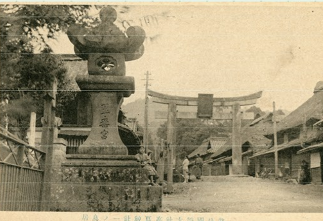
居島ノ一社神良高社大幣園後筑