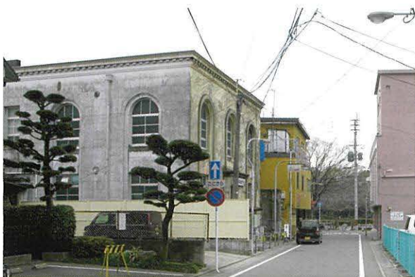
▲旧柳川往還(日吉町)