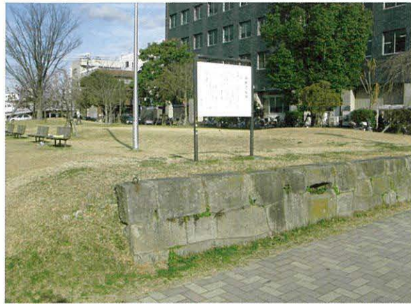
▲御使者屋跡(城南町)

江戸の昔を思い浮かべながら市内を散策してみると、たくさんの発見があるかもしれません。