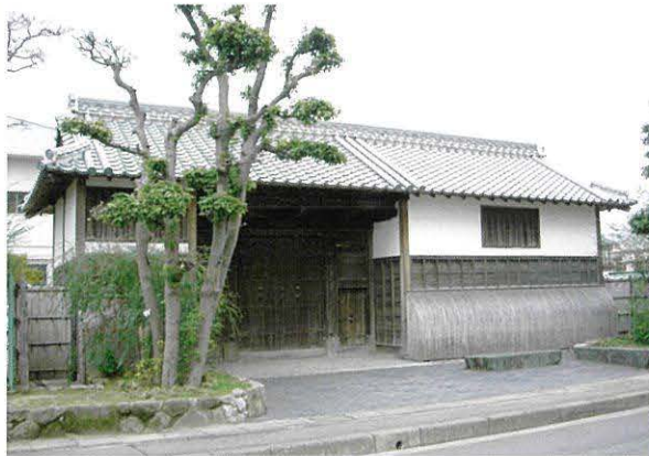
▲旧三島家長屋門(篠山町)