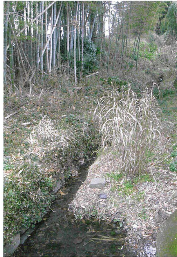
▲久留米城外濠の痕跡(篠山町・櫛原町)

発行機関：久留米市 市民文化部 文化財保護課 久留米市城南町15番地3 TEL.0942(30)9225 FAX.0942 30-9714 発行日：平成22年3月5日