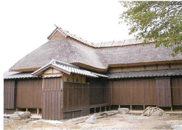
▲坂本繁二郎生家(京町)