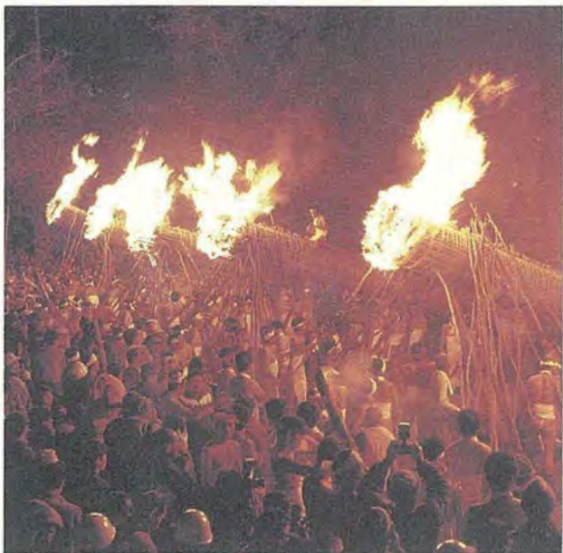
②② 大善寺玉垂宮の鬼夜