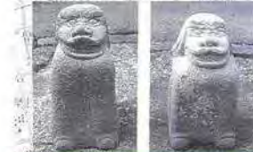
145 活天満宮の樫門の左右に置れた狛犬 活天満宮の樫門を左右に大匠とともに安置されています。肥前狛犬の一種であるが、顔も簡略化されています。