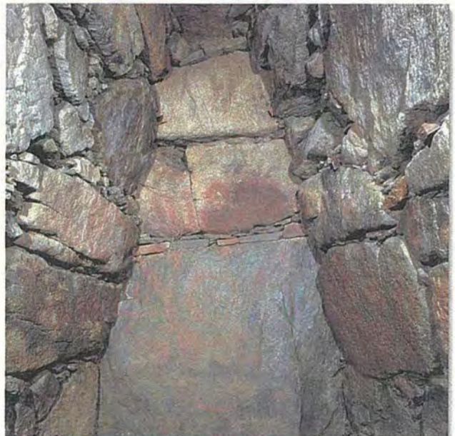
③② 田主丸古墳群(寺徳古墳)