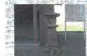
121 高江牛木神社の六地藏石碑 石碑は、天正年間(1573-1585)の作と推測される。奇造、記年銘は不詳であるが、肥前系の六地藏の身体と思われる。