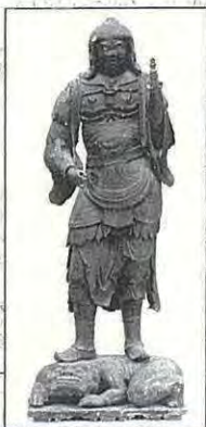
51 木造毘沙門天立像

観音寺蔵。平安時代末から鎌倉時代初めの製作と見られます。甲冑に身をかため、左手に宝塔を掲げ立ちます。毘沙門天は四天王中、北方守護の多聞天のことです。