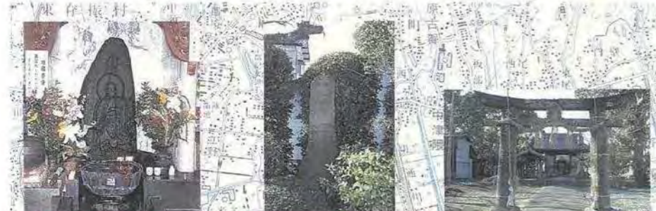
128 七木地蔵板碑 応永三年(1396)年十月通阿弥の銘があり、地蔵菩薩の像が彫られた板碑として平置され、板が一枚に彫られた場所に移ったとの伝説があります。 141 肥前嶋境石 肥前国と筑後国の境界は筑後川の中心で定められていたが、安芸町筑島地区は洪水のため本流が移動し、肥前嶋として筑後国に取り込まれた。 88 明神鳥居系の台輪鳥居 鳥居は、御神系を採るながら、肥前系の構造法で造られている。柱には、筑後川流域の豪族「安東山鹿」の銘文が記されている。元禄10年(1697)の建設です。