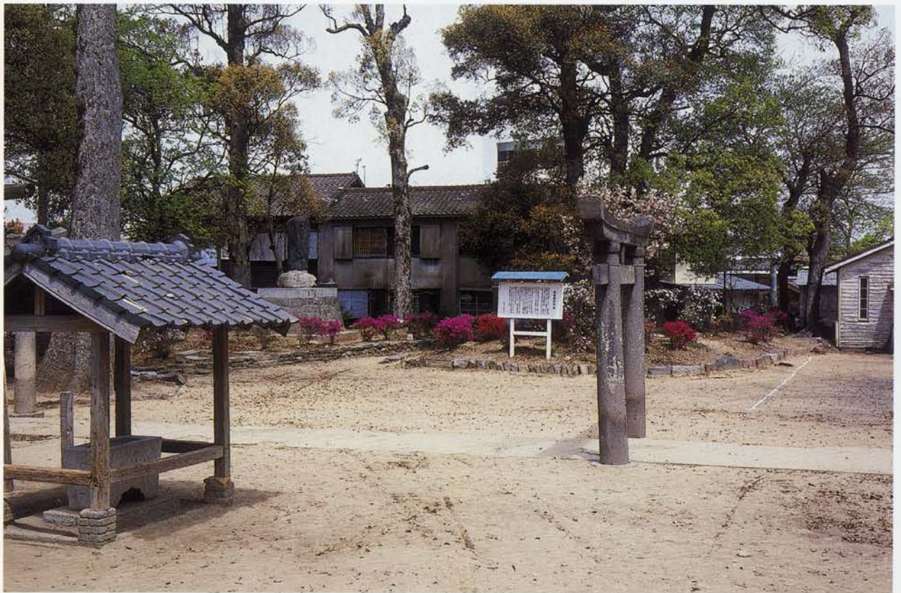
筑後国分寺跡の所在する国分町日吉神社境内