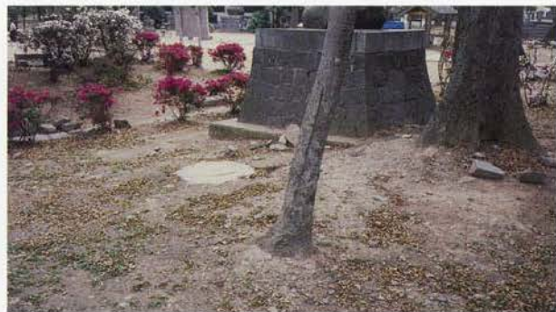
日吉神社に残る講堂跡の礎石

筑後国分僧寺は、確認された講堂と塔ならびに築地を手がかりに推定する。講堂の前面に塔を検出するが、講堂の主軸延長線より東に位置し、その距離は約85mを測る。金堂の所在については、発掘調査によるところはないが、古くは講堂の前面および塔の北西に「塚」の所在が伝えられ、これをもって金堂の基壇と推定したい。講堂・金堂さらに金堂の南東前面には塔が想定される。その他の建物については、東大寺の建物配置に比較すると、推定主軸線上に講堂・金堂・中門・南大門が並び、金堂より中門まで塔を囲んで回廊が設置されたと推定できる。これらの主要な建物の外側を築地が囲んでいる第 図に示すような配置が考えられる。筑前国分寺と同様な配置を示し、同一設計図によるものであろう。