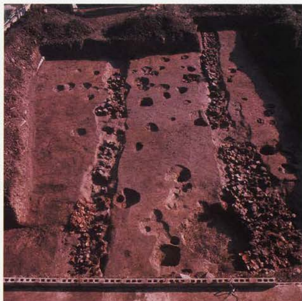
北面築地跡の雨落溝遺構