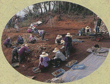
▲朝妻焼窯跡の調査の様子

有田や伊万里から陶工や絵師を招き、磁石は天草から運んで、肥前の焼き物に負けない品質の製品を生産していましたが、わずか十数年で窯を閉じてしまいました。