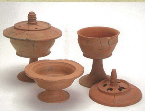
▲ヘボノ木遺跡から出土した土器（香炉）

役人が身に着けたベルトの飾り、文字の書かれた土器や多数の瓦などが見つかっており、役所か寺院の跡ではないかと言われています。