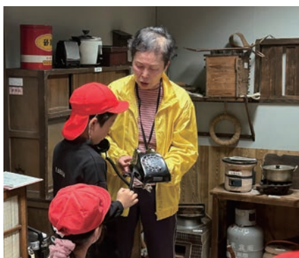
学校見学での体験学習

先生方からは、「子どもたちにとつて大変新鮮な話で、グイグイ引き込まれた」「子どもたちが昔の照明の明るさを体感し、学びを深められた」など、貴重な学びの場として評価を得ています。