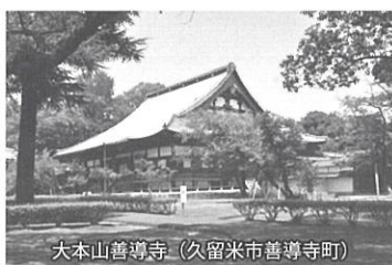
「箏曲発祥の地」記念碑(善導寺)