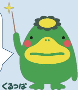
くるっば 久留米市イメージキャラクター

困ったときは、一人で悩まず相談を！相談窓口では秘密を必ず守ります。安心して相談してください。