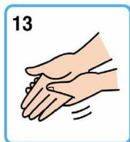
14 手指にすり込む (5回)