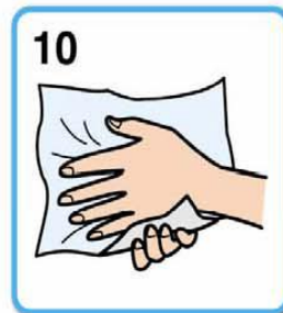
11 ペーパータオルでふく (手指乾燥機で乾燥する) タオル等の共用はしないこと