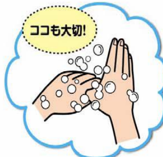
7 親指洗い (5回程度)