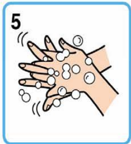
5 手のひらと甲 (5回程度)