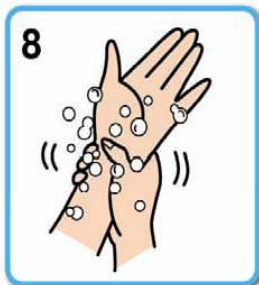
9 手首 (5回程度) 腕・ひじまで洗う