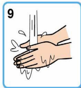
10 水で十分にすすぎ