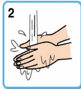
2 ひじから下を水でぬらす