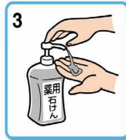
3 手洗い石けんをつけて