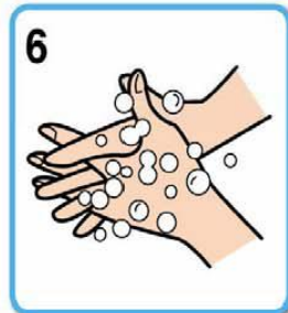
6 指の間、付け根 (5回程度)