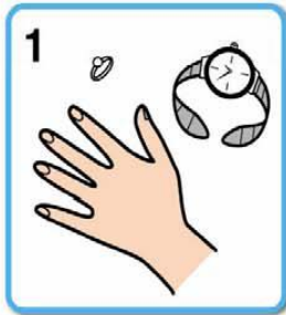
1 時計や指輪はずしたのを確認する