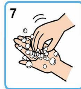
8 指先 (5回程度)