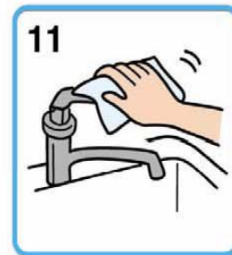
12 蛇口栓にペーパータオルをかぶせて栓を締める