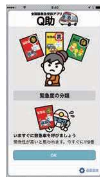
緊急度の分類説明