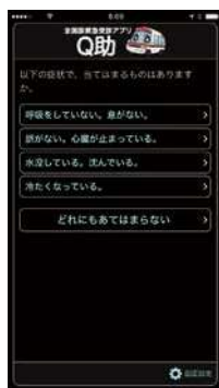
視覚効果「明度反転」