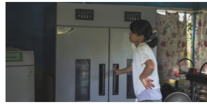
(上)川の駅裏手にあるモリンガ畑 (中)摘んだモリンガの葉 (下)葉を乾燥機に掛け、パウダーにする下準備が完了