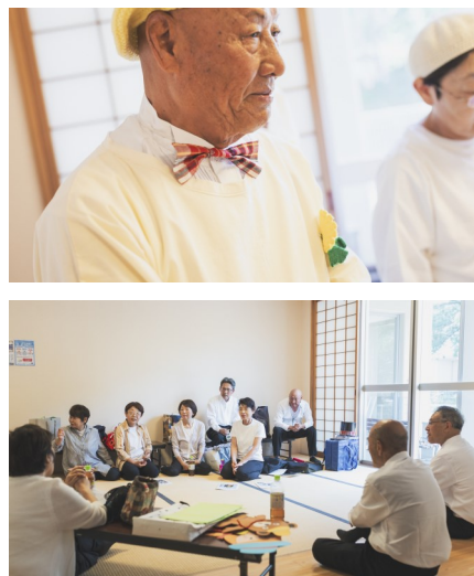
(上) 演奏時の衣装の多くは手作り。スモッグも蝶ネクタイもひまわりのワッペンも、ニットのベレー帽まで (下) 演奏会終了後、控室でメンバーの皆さんにインタビュー。つたない質問にも優しく答えてくれました