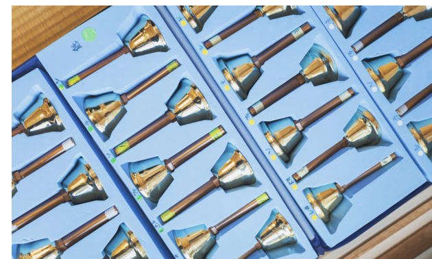
(上) ハンドベルは全員が異なる音を受け持つので、チームワークが必要な楽器です (右) 一人一人が鳴らすベルの音が調和してハーモニーになります