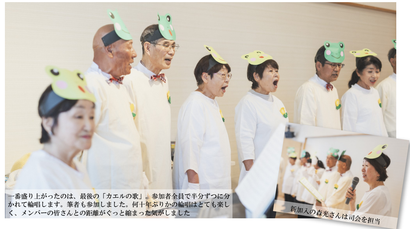
一番盛り上がったのは、最後の「カエルの歌」。参加者全員で半分ずつに分かれて輪唱します。筆者も参加しました。何十年ぶりの輪唱はとても楽しく、メンバーの皆さんとの距離がぐっと縮まった気がしました