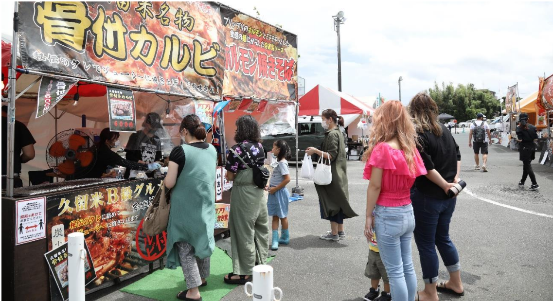
テイクアウトイベント会場。売り上げの一部は市内の大雨被災地域に寄付されることになりました

久留米みらい飯での多くの人の支援は、飲食店の資金面だけでなく“人の心”を支えました。その温かさが基となり、支援側に回る動きも生まれています。さまざまな活動で重要な財源確保。その動きを通して気持ちをつなぎ、支え合いの輪を広げることもできそうです。