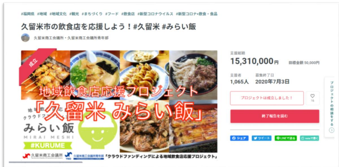
応援プロジェクトのサイトトップ画面。