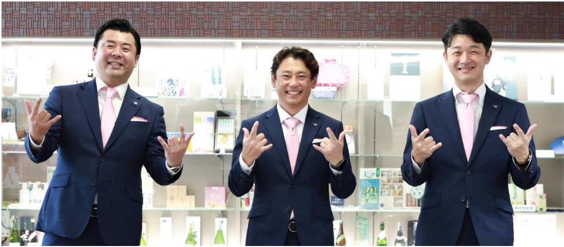
青年部の今年度のスローガン「みんなで WAKU WAKU」のポーズで撮影

久留米みらい飯での多くの人の支援は、飲食店の資金面だけでなく“人の心”を支えました。その温かさが基となり、支援側に回る動きも生まれています。さまざまな活動で重要な財源確保。その動きを通して気持ちをつなぎ、支え合いの輪を広げることもできそうです。