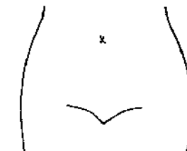
(腸瘻及びびらんの部位等を図示)