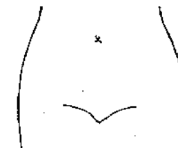
(腸瘻及びびらんの部位等を図示)