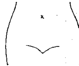
(ストマ及びびらんの部位等を図示)