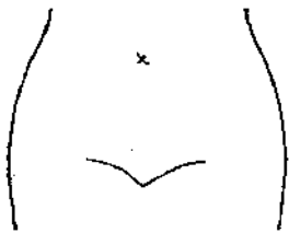
(ストマ及びびらんの部位等を図示)