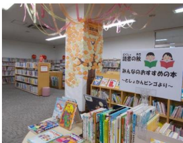
読書の秋～としょかんビンゴ おすすめの本より～