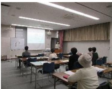
健康講座 in 図書館