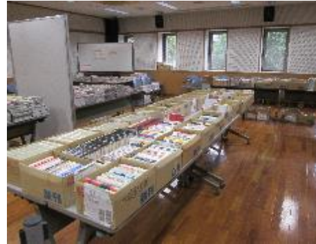
リサイクル古本市