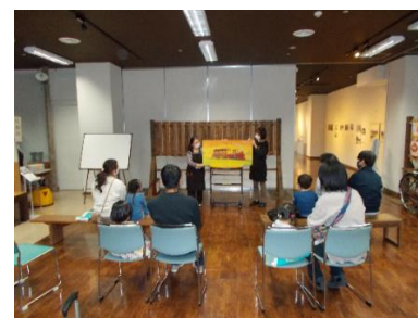
秋のおたのしみおはなし会