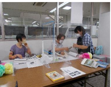
まちゼミ 本の装備体験