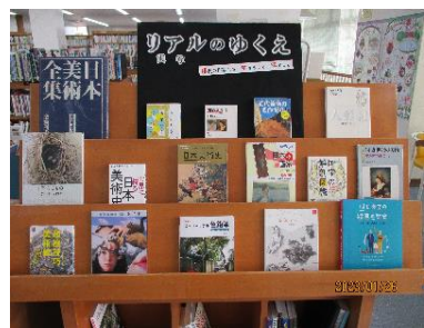
「リアルゆくえ」展示