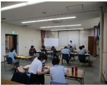
点訳ボランティア養成講座