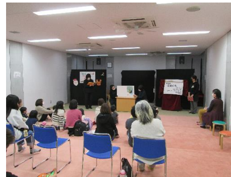
クリスマスおはなし会