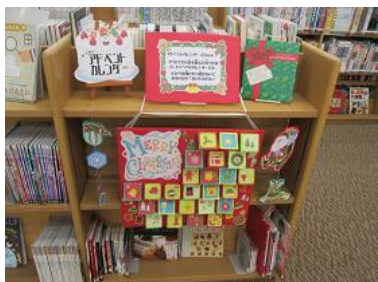
児童企画「めくってみようアド ベントカレンダー」