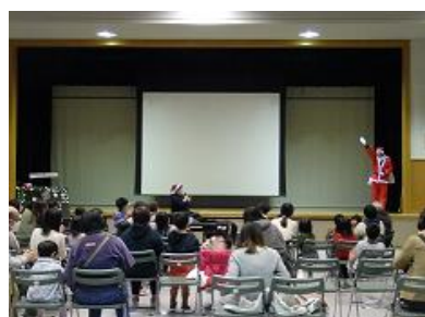
クリスマスおはなし会