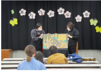
ブックン春のわくわくおはなし会