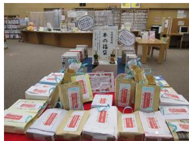
正月企画「本の福袋」