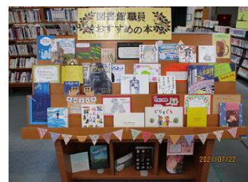
図書館員おすすめの本