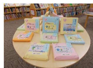
本のお楽しみセット