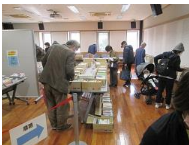
リサイクル古本市