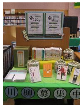
ほろよい川柳大会