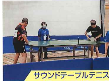
サウンドテーブルテニス