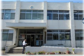
らるご久留米 (久留米市野中町)

久留米市には、 校外教育支援教室「らるご久留米」 があります。 学校の先生に「らるごの見学や利用について相談したいのですが」と声をかけてみてください。