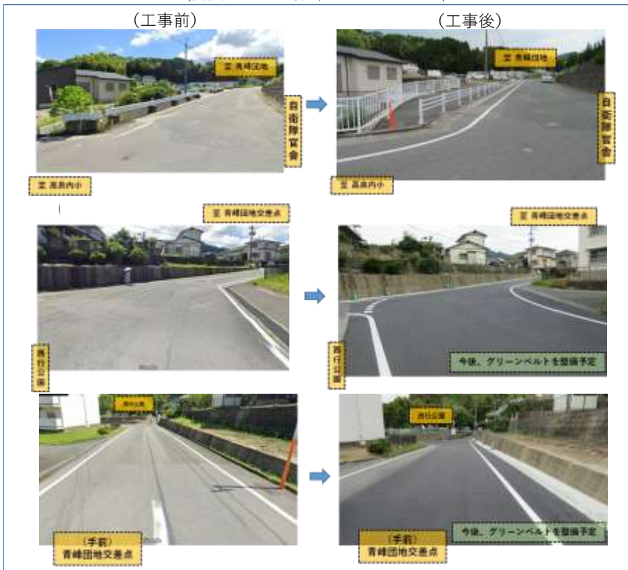
〈高良内小から青峰へ向かうルート〉

発行：久留米市教育委員会 教育部総務 学校規模チーム 電話：0942-30-9213 FAX：0942-30-9719 メール： kyousou@city.kurume.lg.jp