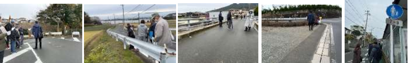
①花の谷団地付近 ②ため池周辺 ③瀬戸の口橋付近 ④高牟礼中付近 ⑤通行規制のある道路