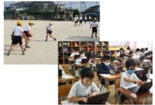
統合後の城島小学校の様子