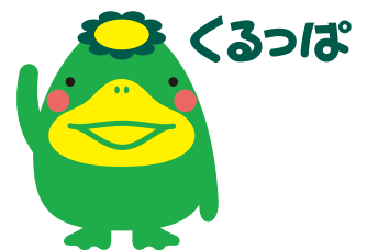
久留米市イメージキャラクター