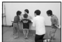
▲稲むらの紙芝居を行うことで子どもたちにも防災の大切さを伝えました。

段ボールでできた大きな防災迷路や防災めりえ、紙芝居、がれき歩き体験など、親子で一緒になって防災について学ぶことができました。