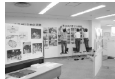
▲市民活動団体活動展示

災害時には市役所も被災することが考えられます。「もしも市役所機能がストップしたら!？」というテーマで、5 グループに分かれて意見交換を行いました。「とにかく隣近所の住民同士が助け合いながら生き延びる」、「本来あるべき住民自治の姿に立ち返る」、「地域外の NPO やボランティアの支援を受ける」などの意見が出されました。ワールドカフェを通じて、災害時に私たち市民一人ひとりはどうすればいいのかを参加者同士で考えることで、有意義な話し合いになりました。