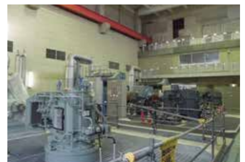
篠山排水ポンプ場