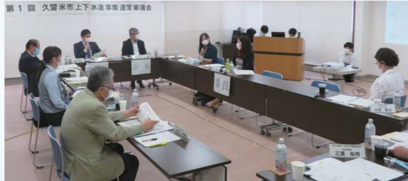
審議会は学識経験者や市民代表の皆様で構成しています

8月末から9月中旬にかけて、市民の皆様を対象に上下水道事業に関するアンケート調査を実施予定です。調査票がお手元に届きましたら、ご協力をお願いいたします。