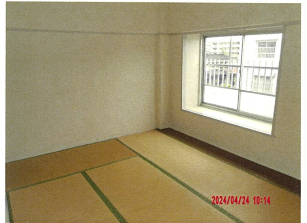
21 花園住宅, 3棟14号