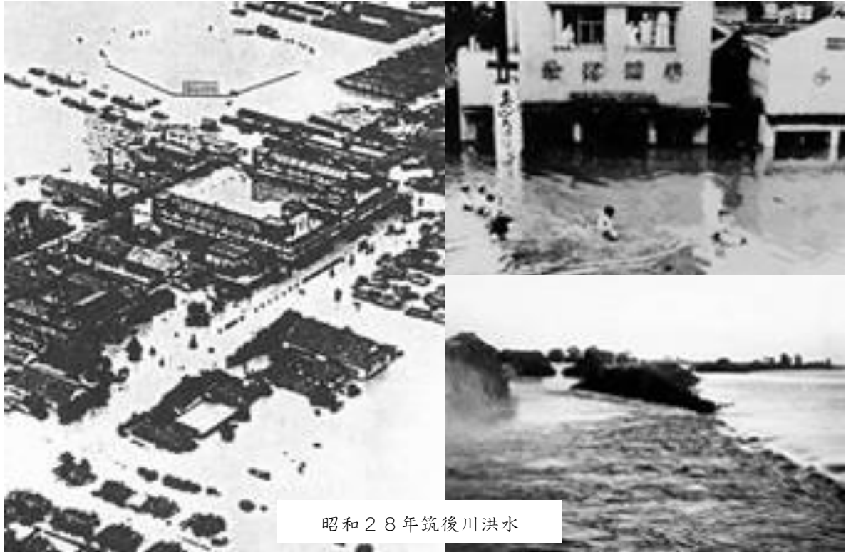
昭和28年筑後川洪水