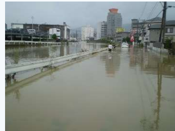
下弓削川左岸 浸水状況（H30年7月）

⇒住宅等が浸水する被害が多く発生した下弓削川流域においては、被害軽減に向け、国県市の役割分担のもと ハード対策を集中的に実施 。