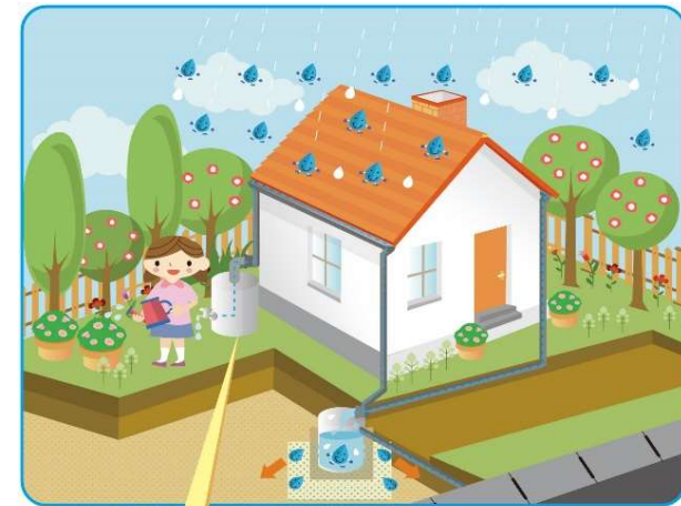
雨水貯留施設(タンク)

・河川・水路等への雨水流出を抑制するための雨水貯留施設(タンク)の設置に要する費用の一部を助成する制度の創設を行う。