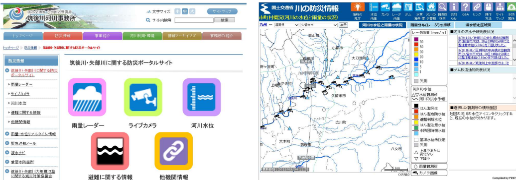
「筑後川・矢部川防災ポータルサイト」のページ例

・各防災行政機関が各機関のHPにおいて発信している防災情報サイトを利用者がアクセスしやすいようにとりまとめ、一元的に閲覧できる「筑後川・矢部川防災ポータルサイト」を筑後川河川事務所HPに開設し、地域の防災力向上(自助・共助)を図る。 ※実施中