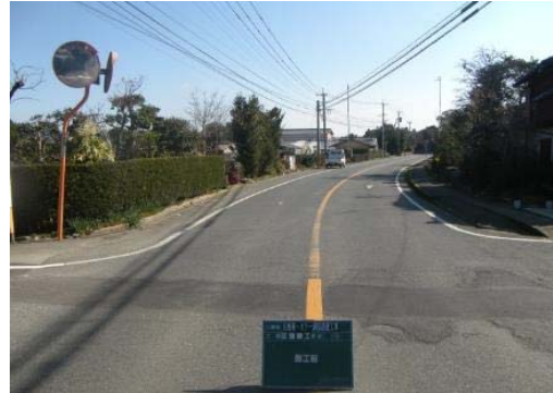
② 道路がカーブしているため、見通しが悪く、車のスピードが速い。

＜対策メニュー＞ ・取り締まりの強化【警察】 [平成25年度対策済] ・路面標示【県】[平成27年3月対策済] ・安全指導【学校】[平成25年度対策済]