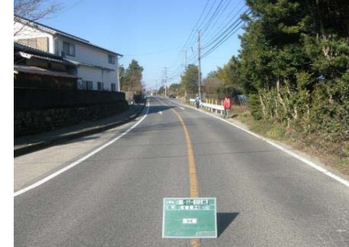
③ 見通しが悪く、車のスピードが速い。

＜対策メニュー＞ ・路面標示【県】[平成27年3月対策済] ・安全指導【学校】[平成25年度対策済]