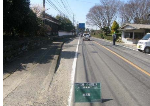
① 路側帯が広く、車に停車されると見通しが悪い。