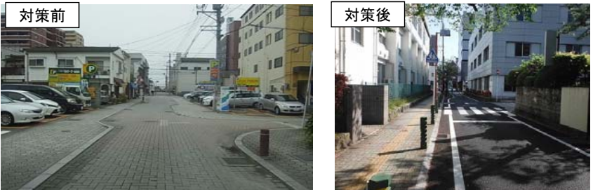
② 材質がブロックのため、歩車道の境界がわかりにくい。

＜対策メニュー＞ ・安全指導【学校】 [平成27年度対策済] ・区画線塗り直し【市】 [平成28年度対策済]