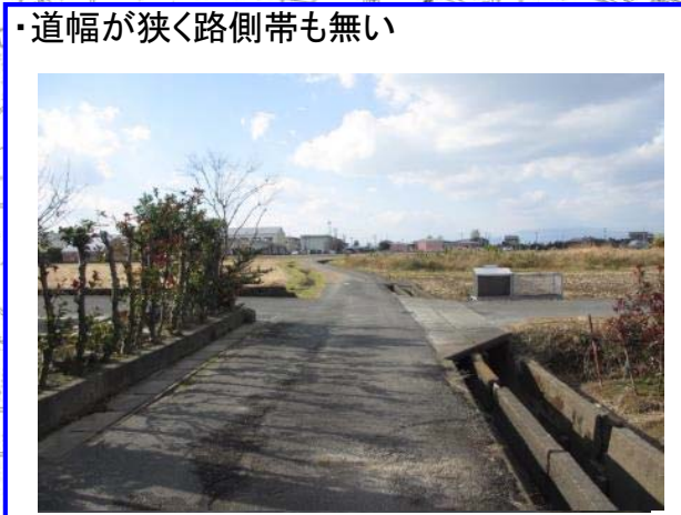
・道幅が狭く路側帯も無い