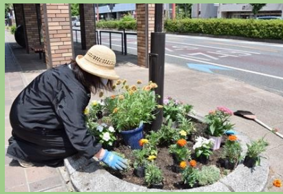
カトリック久留米教会さん