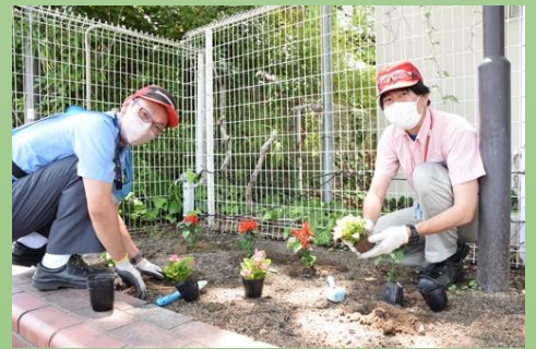
株式会社ブリヂストン久留米工場さん