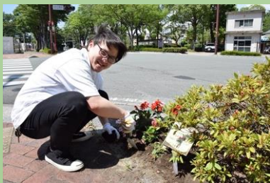
くるめ接骨院さん

どのエリアも花と緑への想いが溢れる花壇になり、通りにも心にも彩りが添えられました。一部ですが、花植えの様子をご紹介します。写真を掲載させていただいた方以外の、すべてのサポーターの皆様もお疲れ様でした！