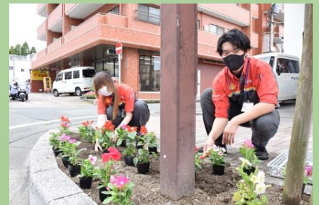
最所産業株式会社 通町 S/S さん