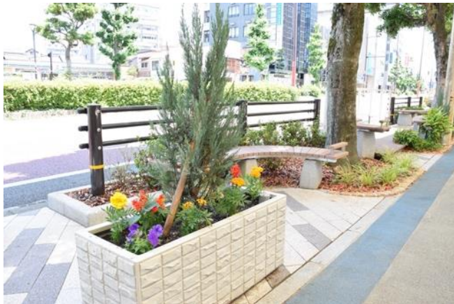
明治通り緑化スポット（南側）

明治通りの日吉町交差点東側に、花壇とベンチを備えた緑化スポットが完成しています。南側の緑化スポットは、サポーターを大募集中です。