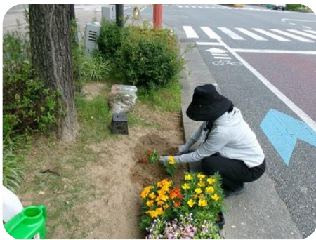
NTT 西日本久留米営業所さん