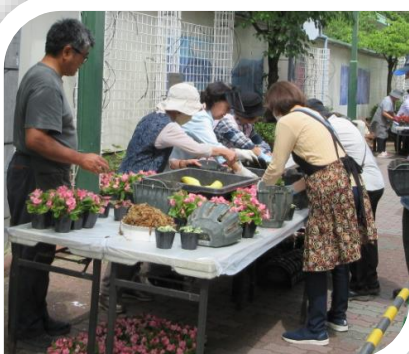
2番街商店街ハンギング バスケットづくり