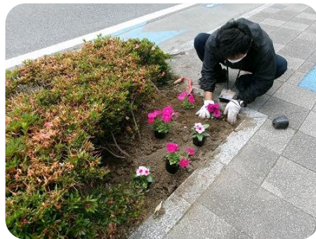
児童デイサービス発達ラボさん