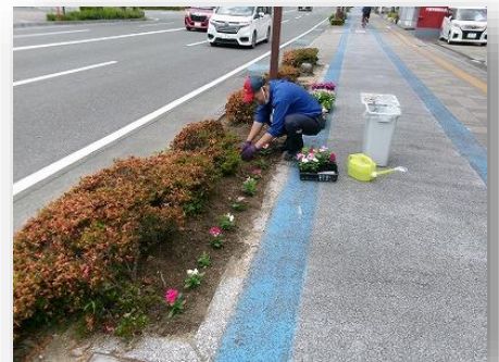
林兼石油(株)久留米駅前 S.S さん