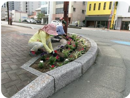
ハピネスフラワーハーモニーさん