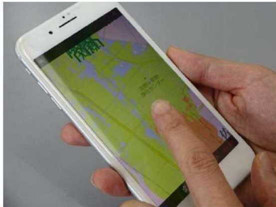
ウェブ版ハザードマップのイメージ

・様々なハザードマップをパソコンやスマートフォンで容易に閲覧できるウェブ版ハザードマップを導入し、市民の防災意識の啓発・向上を図る。(R2年度より実施予定。)