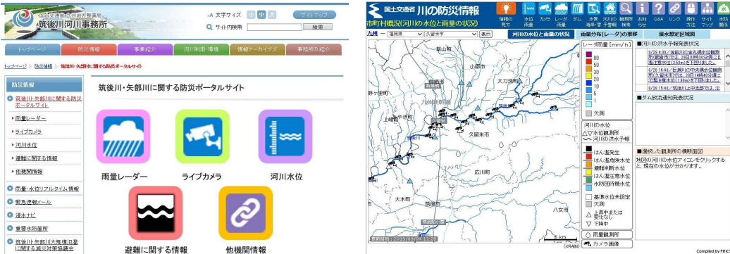
「筑後川・矢部川防災ポータルサイト」のページ例

・各防災行政機関が各機関のHPにおいて発信している防災情報サイトを利用者がアクセスしやすいようにとりまとめ、一元的に閲覧できる「筑後川・矢部川防災ポータルサイト」を筑後川河川事務所HPに開設し、地域の防災力向上(自助・共助)を図る。 ※実施中