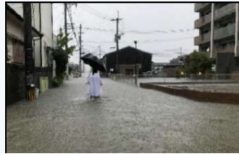
池町川左岸 浸水状況 (H30年7月)