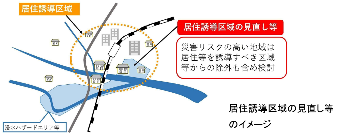
居住誘導区域の見直し等のイメージ

引き続き災害の発生のおそれのある土地の区域においては、居住誘導区域からの除外も含め、長期的・全市的な視点で区域の見直しを図る。