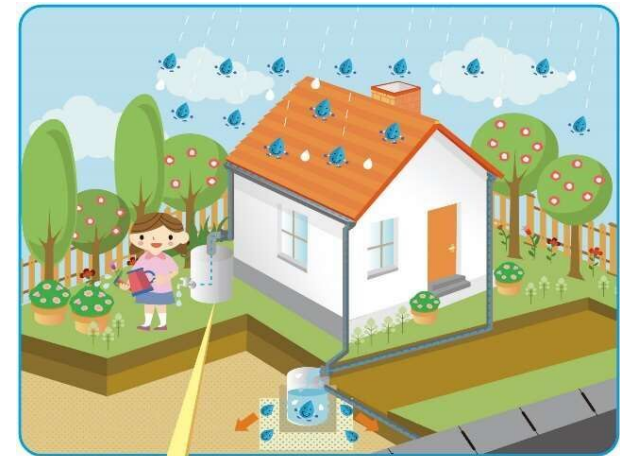
雨水貯留施設(タンク)

・河川・水路等への雨水流出を抑制するための雨水貯留施設(タンク)の設置に要する費用の一部を助成する制度の創設を行う。