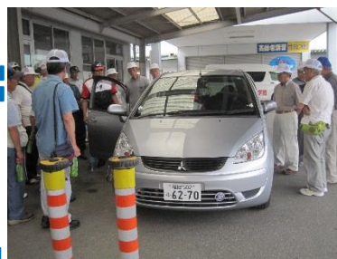
シルバーセーフティスクールの様子