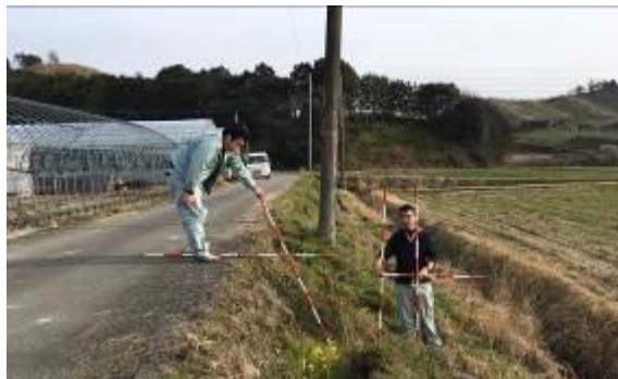
●災害査定申請に向けた測量の様子