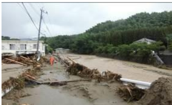
●河川が土砂で埋まっている様子

昨年末までの災害査定申請が一段落し、年明けからは道路や河川などの復旧工事を発注しています。特に生活道路や土砂で埋まっている河川の断面確保の工事など、優先順位の高い箇所を地元住民や関係機関と調整しながら工事発注を行っています。今では施工業者も決定し、復旧作業が目に見えて進み、職員一丸となって業務に取り組んでいる状況です。