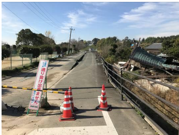
●道路が隆起し通行できない状況

現在は他工事（下水道、水道等）も多いため、工事の工程調整を密に行い、町民の方や他工事関係者と協力し合いながら、日々業務に励んでいる状況です。