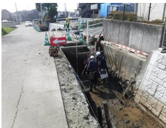
●現場立ち会い状況