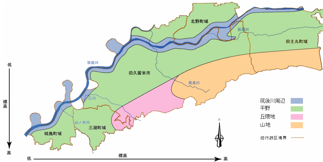
図 4-1-1 久留米市の自然環境の概況

本市の環境は土地利用、植生情報から大きく「筑後川周辺」、「平野」、「丘陵地」、「山地」の4区分に分けることができます。さらに「筑後川周辺」では筑後大堰を境に“汽水域”、“中流域”、“平野”では“低平地（クリーク地帯）”、“平地”、“複合扇状地”に細区分することができます。このように、本市には多様な環境が存在し、それぞれの環境に応じた多様な自然環境がみられます。