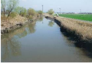
A 城島町浮島（旧河道内の低湿地）