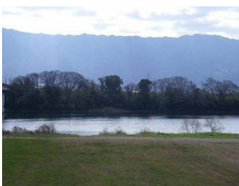
E 筑後川中流域（恵利堰周辺）