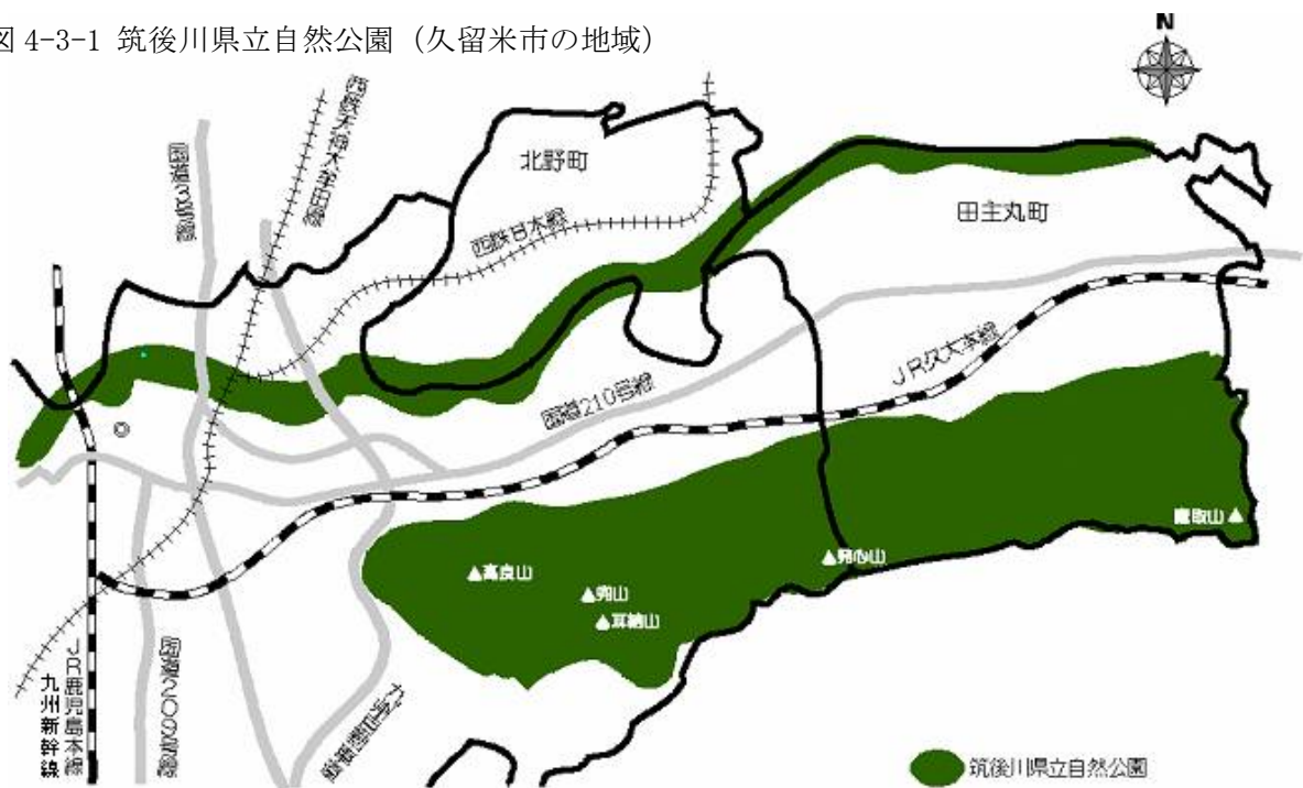
図 4-3-1 筑後川県立自然公園（久留米市の地域）

優れた自然の風景地の保護とその利用増進を図ることを目的とした「福岡県立自然公園条例」に基づき、筑後川や耳納山地及び古処山地（朝倉市周辺）は「筑後川県立自然公園」として指定され、平成4年5月に公園計画が作成されています。