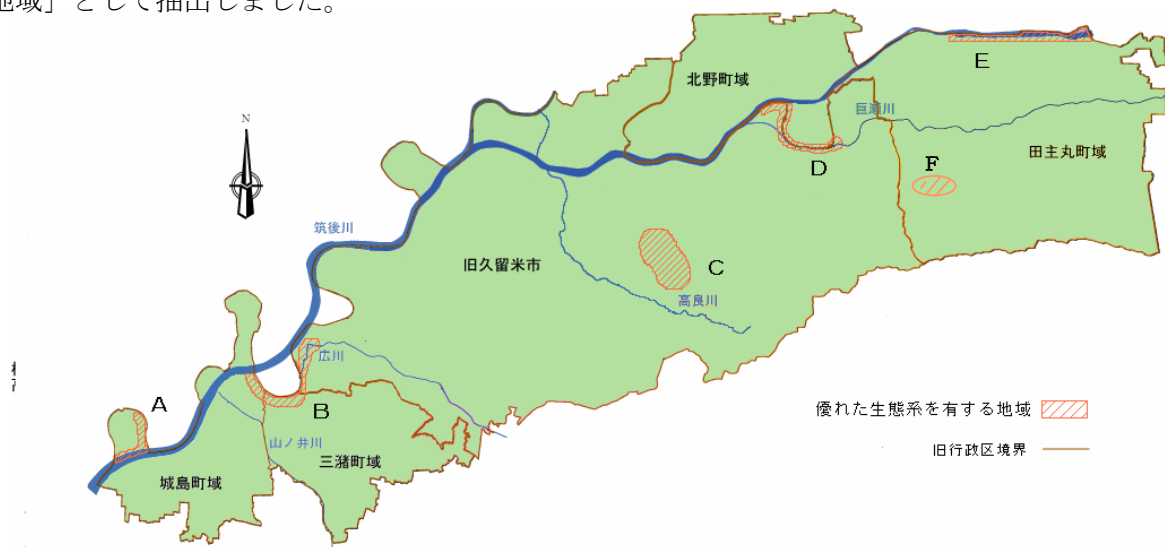
図 4-1-2 優れた生態系を有する地域

本市では、平成9、10年に旧市域で実施した自然環境調査の結果から、「優れた生態系を有する地域」として、3地域（広川河口、鎮西湖、高良山）を抽出しました。その後、平成17年の合併後の新市域の自然環境の状況を把握するため、平成20～22年度に旧4町域を中心として自然環境調査を実施し、その結果、新たに2地域（城島町浮島、筑後川中流域(恵利堰付近)）を「優れた生態系を有する地域」として抽出しました。