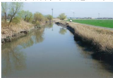
A 城島町浮島（旧河道内の低湿地）