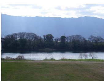
E 筑後川中流域（恵利堰周辺）