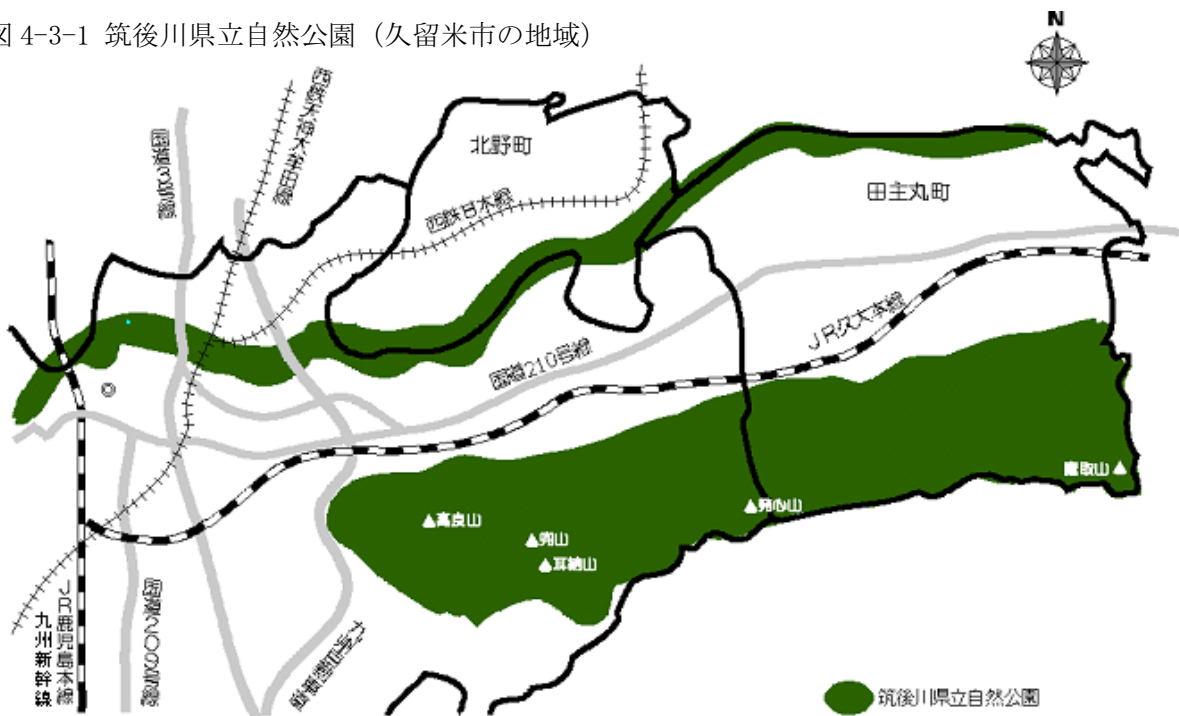
図4-3-1 筑後川県立自然公園（久留米市の地域）

優れた自然の風景地の保護とその利用増進を図ることを目的とした「福岡県立自然公園条例」に基づき、筑後川や耳納山地及び古処山地（朝倉市周辺）は「筑後川県立自然公園」として指定され、平成4年5月に公園計画が作成されています。