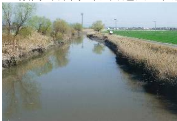
A 城島町浮島（旧河道内の低湿地）