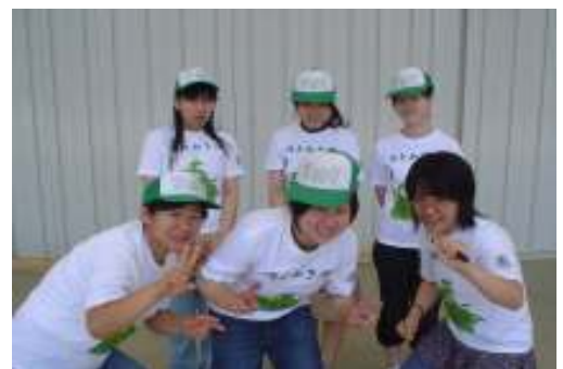
活動は5名から10名でしています!!

「ほとめき」には「おもてなし」という意味があり、清掃活動を行いながら、子供バルーンアートの活動もしているのがほとめき隊の取組みです。西鉄久留米駅周辺で、子供たちに無料でバルーンアートをプレゼントしています。清掃途中でも、声をかけてもらえればその場で作って、プレゼントしてくれます。