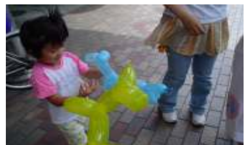
子供たちに大人気のバルーンアート